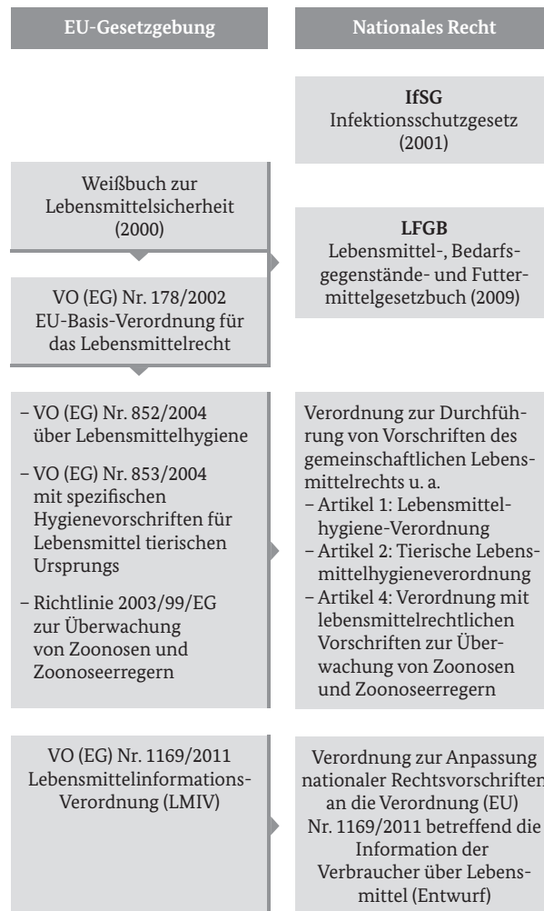
Abbildung 1: Übersicht über die rechtlichen Rahmenbedingungen in der Gemeinschaftsverpflegung

Außerdem wird die Anwendung einschlägiger DIN-Normen (zum Beispiel 10508 Temperaturen für Lebensmittel, 10526 Rückstellproben in der GV, 10524 Arbeitskleidung, 10514 Hygieneschulung) empfohlen. 42