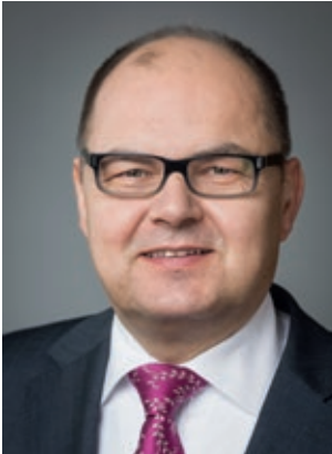
Christian Schmidt