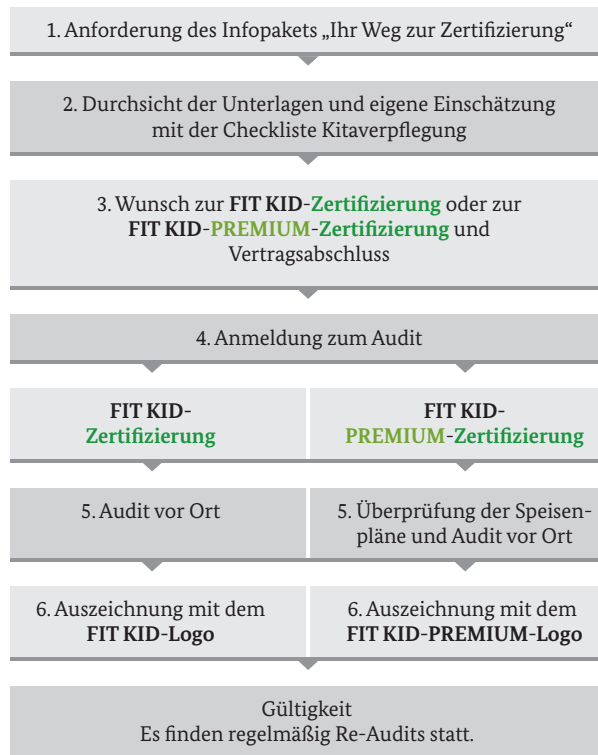
Abbildung 3: Ablauf der Zertifizierung 60

Zur Zertifizierung stehen unterschiedliche Informationsmaterialien zur Verfügung. Tabelle 9 zeigt deren Inhalte und Bezugsquellen.