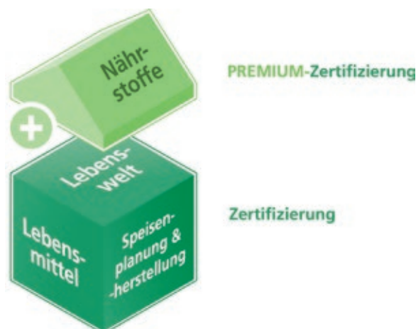
Abbildung 2: Qualitätsbereiche der Zertifizierung

Nach bestandenem Audit wird der Tageseinrichtung für Kinder ein Zertifikat einschließlich Logo-Schild verliehen, das die FIT KID-PREMIUM-Zertifizierung ausweist. Die folgende Abbildung 2 stellt die Qualitätsbereiche der Zertifizierung dar.